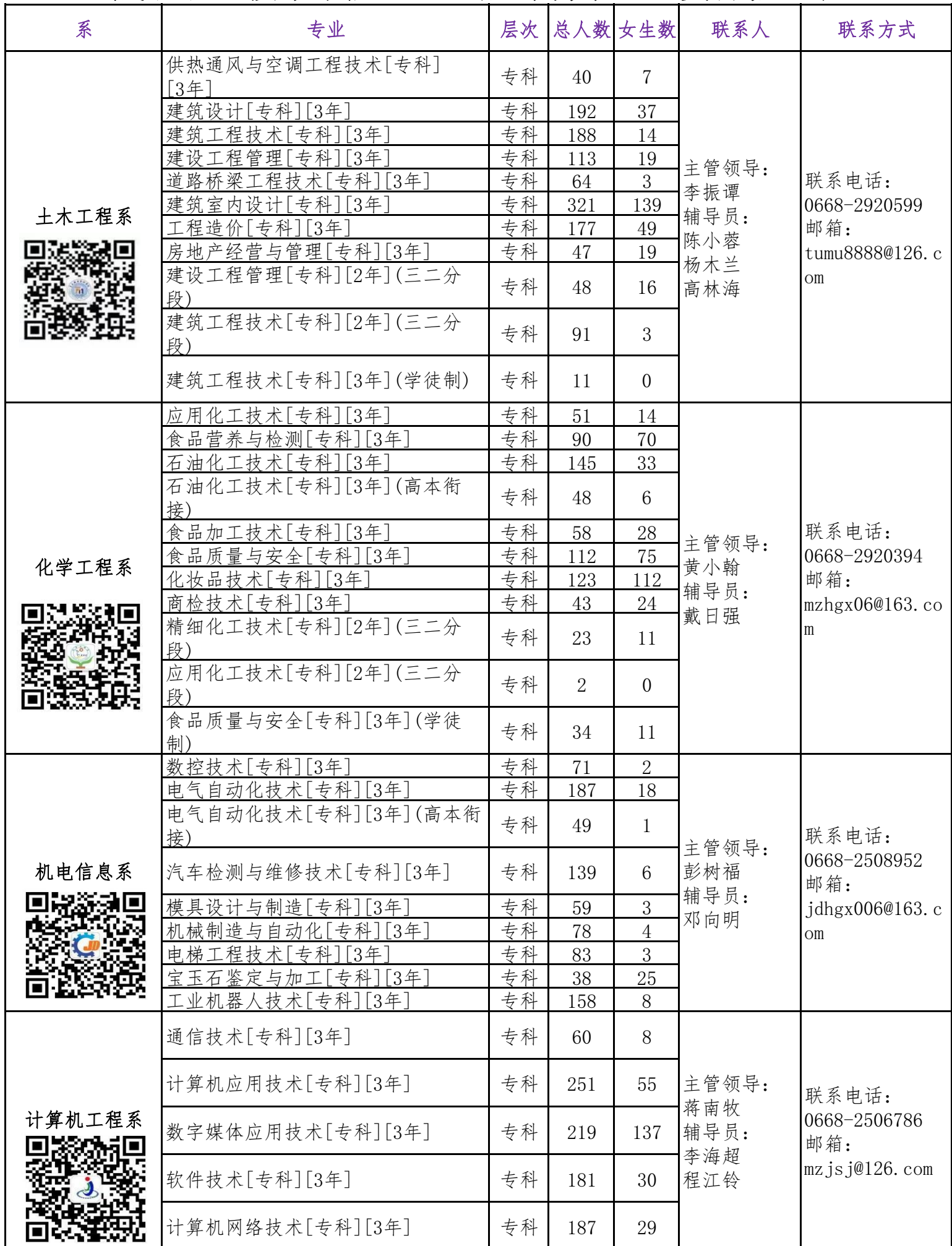
茂名职业技术学院 2023 届专科毕业生资源信息表